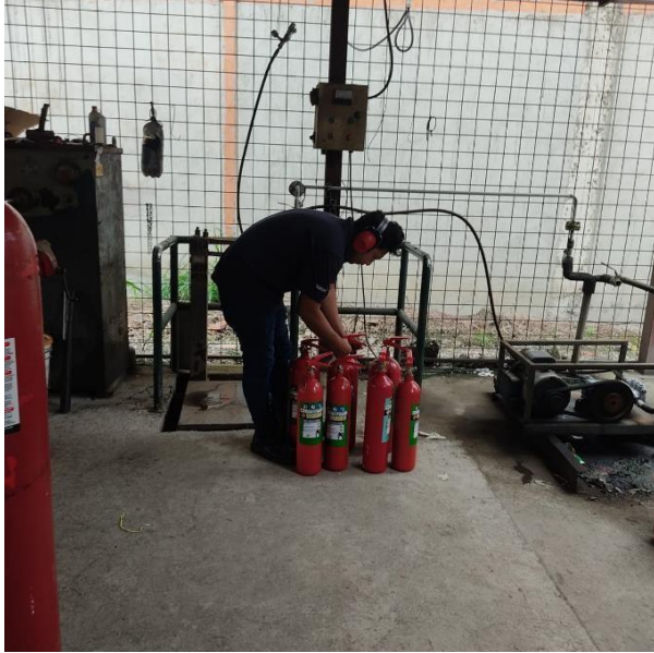
INSTALACIÓN DE ACOPLES PARA TRASVASADO DE CO2