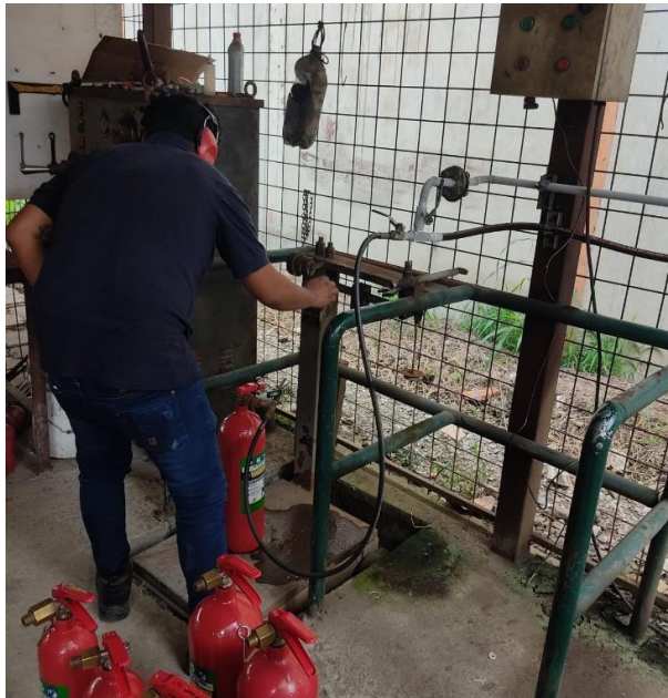
TOMA DE PESOS Y PRESIÓN