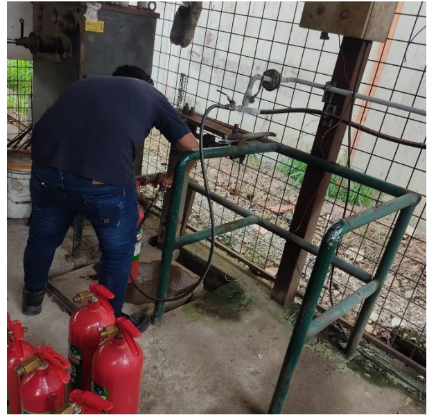
INSTALACION DISPENSADOR DE CO2 CALIBRACIÓN DE PESOS Y